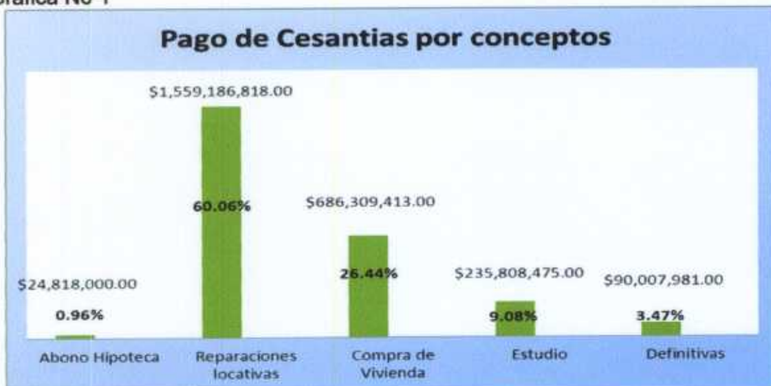
Gráfica No 1

Con el reconocimiento y pago de cesantías, se ha contribuido a la adquisición de vivienda para 51 afiliados y que 161 de estos, hayan acometido reformas locativas a sus viviendas, contribuyendo al mejoramiento de la calidad de vida de los afiliados.