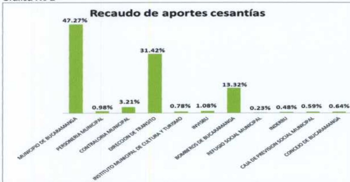
Gráfica No 2